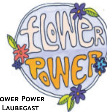
FLOWER POWER IN LAUBEGAST

Am 10. Februar fand in der zum Thema passend geschmückten Christophoruskirche die Flower Power Tanzparty statt. Organisiert von der Laubegaster JG gab es neben kulinarischen Leckereien, die von den Gästen mitgebracht wurden, den Getränken an der JG Bar viele Möglichkeiten, das Tanzbein zu schwingen. Von der Moderatorin durch den Abend geführt, gab es Anleitungen zum Line Dance und anderen Choreos sowie lustige Gruppenspiele bei denen Luftballons eine wichtige Rolle spielten. Die überraschend weit gefächerte Musikauswahl wurde von der JG selbst zusammengestellt und reichte von Hits der 80er bis zu aktuellen Titeln. Ein weiterer Höhepunkt war die Prämierung der drei besten Kostüme durch eine Jury. Wir hatten viel Spaß und finden der viele organisatorische und technische Aufwand hat sich gelohnt. Nächstes Jahr dürfen gerne mehr Junge und Junggebliebene zu diesem Tanzabend kommen. Vielen Dank an alle Mitwirkenden und Gäste für diesen wunderschönen Abend.