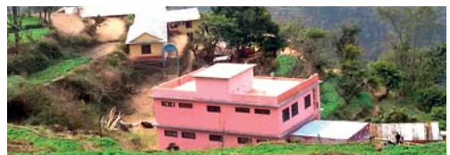
Neues Schulgebäude 15.2.2019